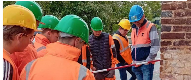
Rouen (76) – Raccordement du Pont Flaubert à la Sud III, Bouygues TP