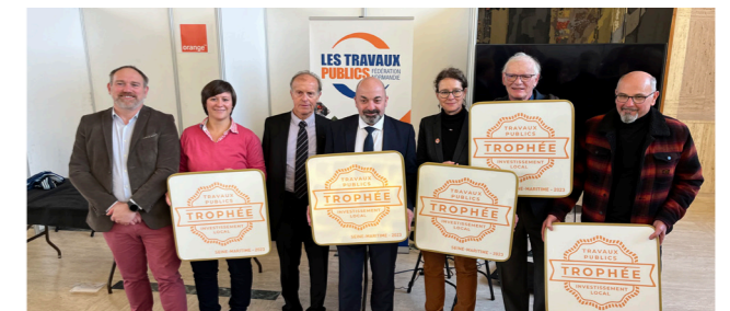
Assemblée Générale de l'ADM76 à Rouen, le 2 décembre 2023