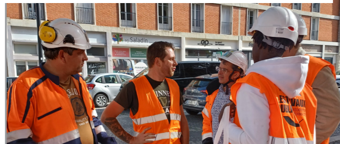
Le Havre (76) – Requalification des Boulevards Winston Churchill, Eurovia