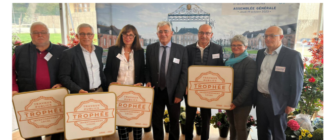
Assemblée Générale de l'AMO au Haras du Pin, le 19 octobre 2023