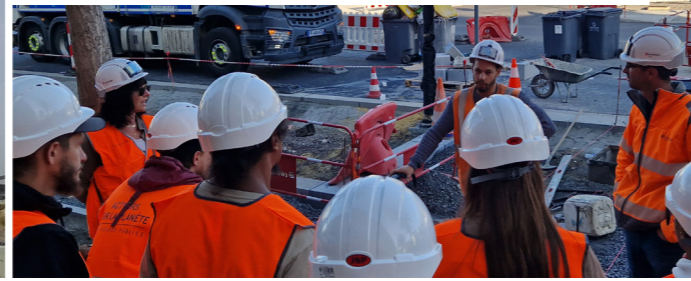
Offranville (76) – Remplacement d'éclairage public, Cegelec Sdem