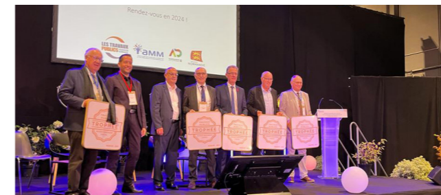
Assemblée Générale de l'AMM à Saint-Lô, le 20 octobre 2023