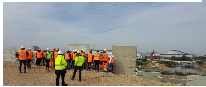
Le Havre (76) – Requalification des Boulevards Winston Churchill, Eurovia