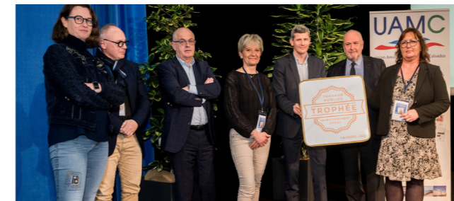
Assemblée Générale de l'UAMC à Caen, le 3 avril 2023