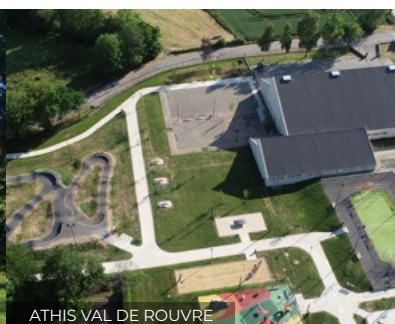
ATHIS VAL DE ROUVRE