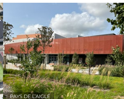
PAYS DE L'AIGLE